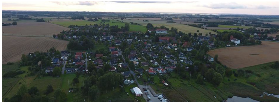
Udtaget jan. 2020. Oplag: 400.